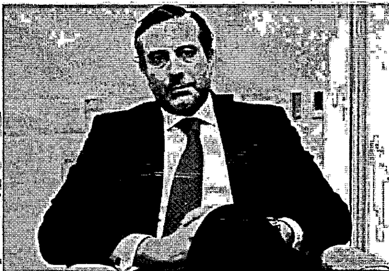
El magistrado y portavoz del Poder Judicial, ayer en su visita a Valladolid.