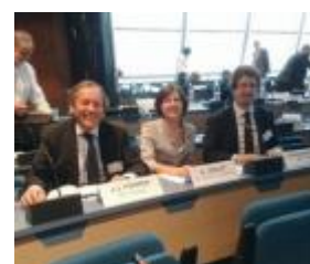
Intervención durante el panel en el que se presentó el proyecto de Aulas de Derechos Humanos

La Abogacía Española participó la semana pasada en Estrasburgo (Francia) en una nueva reunión de la plataforma HELP, auspiciada por el Consejo de Europa para mejorar las prácticas de formación pluridisciplinar en materia de Derechos Humanos para jueces y otros profesionales del Derecho, en representación de la Fundación de la Abogacía Española. La sesión inaugural contó con la intervención de Dan Spielman, presidente del TEDH, que expresó la necesidad que tienen los jueces de otros profesionales para decidir asuntos en la sociedad actual, alegando que el propio TEDH puede declarar la violación del CEDH si el juez nacional rechaza una opinión pericial. La Abogacía Española tuvo la oportunidad de presentar la Guía para Abogados ante el TEDH , realizada por CCBE y editada para su versión en español, así como el Proyecto de Aulas de Derechos Humanos gestionado por la Fundación de la Abogacía Española. Igualmente, intervino junto con representantes de las Abogacías de Francia, Bélgica y Luxemburgo en el panel sobre cursos on-line relativos a Derechos Humanos, aprovechando para presentar el curso sobre Derecho de Asilo que se celebrará el próximo 18 de septiembre en la sede del Consejo General de la Abogacía en Madrid, dentro también de la iniciativa HELP – los abogados interesados en participar pueden remitir su candidatura hasta el 15 de julio al correo electrónico bruselas@abogacia.es