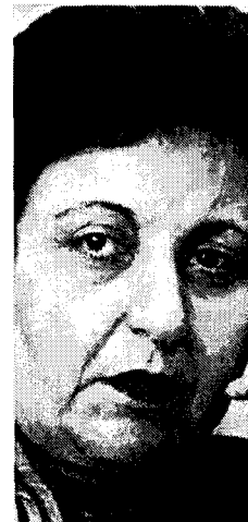
Shirin Ebadi. A. CARRASCO

La abogada se lamenta al hacer mención a las leyes que todavía imperan en Irán. “Me siento avergonzada y humillada al ver las leyes de mi país”. Ebadi reconoce “llorar por dentro porque en pleno siglo XXI, en Irán contamos con castigos como lapidar, ejecutar a menores de edad, realizar amputaciones por hurtos y robos, crucificar, dar latigazos, ahorcar...”. ♦ REDACCIÓN