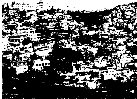
El barrio donde se suspende la demolición.

Pero los palestinos creen que se trata de una más en la cadena de decisiones que se aplican continuamente para expropiar sus propiedades en el sector ocupado de Jerusalén. Israel no da permiso a los palestinos para construir vi-