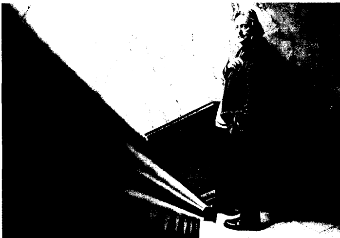
Michael Mansfield. en las escaleras del Colegio de Abogados de Barcelona.

Abogado. Miembro del Tribunal Russell sobre Palestina que juzga violaciones de los derechos humanos por Israel