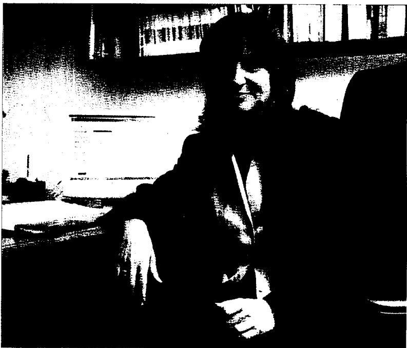
►► Silvia Jiménez-Salinas, degana del Col·legi d'Advocats de Catalunya.

Malgrat això, l'ACAPS està pendent de si la justícia donarà més valor a aquest compromís previ o bé al document de què disposa la família acollidora, en el qual el pare biològic del nen els concedeix la custòdia, amb l'objectiu que pugui disposar d'una millor qualitat de vida i de millors estudis a l'Estat espanyol. Els