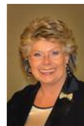
Viviane Reding, Vicepresidenta de la Comisión Europea encargada de Justicia, Derechos Fundamentales y Ciudadanía

La Comisión Europea ha presentado el Segundo Informe anual sobre la implementación de la carta Europea de Derechos Fundamentales. La Carta de los Derechos Fundamentales de la UE, instrumento en vigor y jurídicamente vinculante desde hace más de dos años, inspira la actividad legislativa de la UE desde la fase más incipiente de los proyectos hasta la promulgación definitiva de los actos, consagrando una serie de derechos fundamentales, que recogen los valores comunes y el acervo constitucional de Europa. Este segundo informe anual concluye que la necesidad de respetar los derechos humanos se halla cada vez más integrada en el proceso de elaboración de políticas de la UE. El TJUE cita la Carta con una frecuencia cada vez mayor, especialmente, en resoluciones emblemáticas en materia de discriminación por razón de sexo o de protección de la privacidad en internet. La Vicepresidenta y Comisaria de Justicia, Viviane Reding, ha declarado: «Mi objetivo primordial desde que la Carta adquirió carácter vinculante ha sido crear una sólida cultura de protección de los derechos fundamentales en toda la Unión. Hemos conseguido que la Carta sea el diapasón que marque el tono de todas las políticas decididas al nivel de la UE». «Nos incumbe ahora la tarea de ayudar a los ciudadanos a ejercer sus derechos en la práctica, asegurarnos de que saben dónde acudir en caso de vulneración de sus derechos».