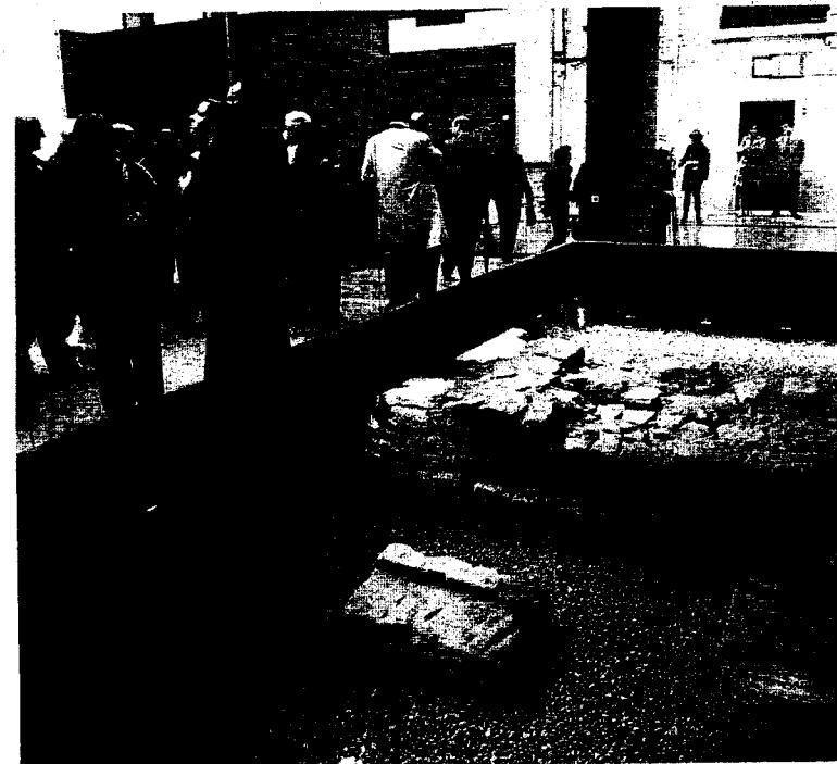
HALLAZGOS. De la iglesia de San Juan Bautista (siglo XII) y del palacio de Alfonso III (siglo IX). / M. R.

La institución pedirá un convenio de colaboración y la edición de un folleto