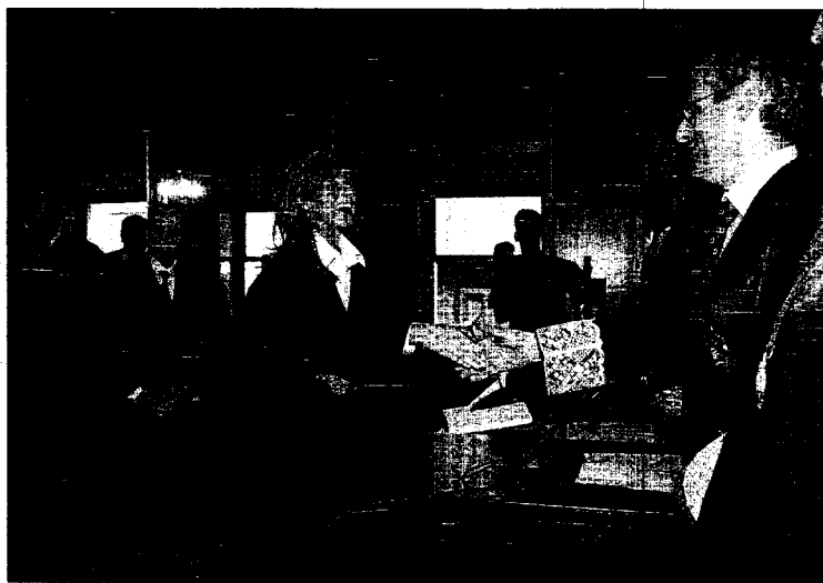
El fiscal-jefe en funciones saluda a una de las abogadas tras el juramento de la Constitución.

«El papel de la abogacía se había venido desdibujando hasta alcanzar cotas máximas», continuó el decano, quien se congratuló de que «se haya llegado a la conclusión de considerar al abogado como un actor más de la Administración de Justicia y no como un mero colaborador».