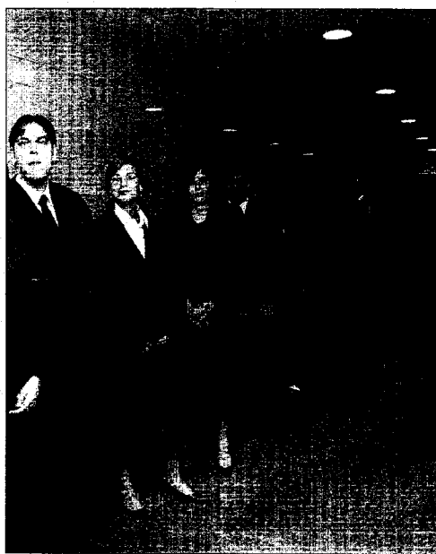
Algunos de los abogados, instantes antes de iniciarse el acto.