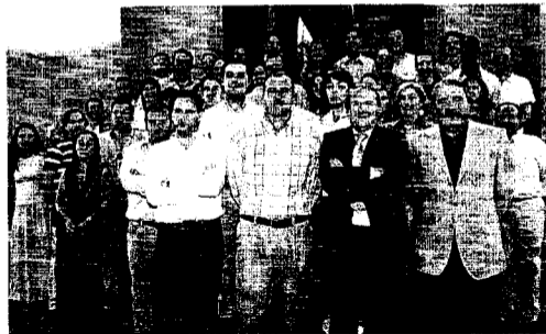
FOTO DE FAMILIA. Los abogados, en Trascorrales.