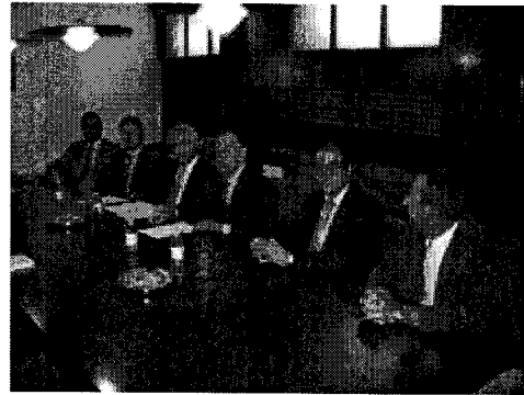
El acuerdo ha sido suscrito esta mañana