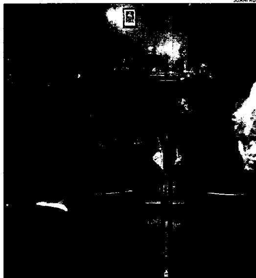
La Escuela de Práctica Jurídica incluirá un curso sobre violencia de género

Además, la recién creada y puesta en marcha Escuela de Práctica Jurídica va a incorporar en fechas próximas un curso sobre esta materia, con la finalidad de impulsar la formación de los letrados que se incorporan a la profesión. En los meses en que lleva en funcionamiento, los alumnos han recibido formación incluso por parte de un notario, y en breve acudirán