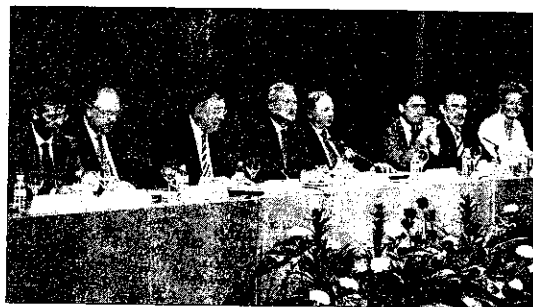
Ponentes del Congreso en un momento del acto.

La finalidad pretendida con la celebración del referido Congreso era articular una reflexión común entre quienes sirven en el Orden Jurisdiccional Social para que, tras la elaboración y estudio de las ponencias programadas, se analicen las cuestiones centrales que afectan al mismo, de manera que se elaboren propuestas de futuro que se harán llegar tanto al Consejo General del Poder Judicial como a los Poderes Públicos con capacidad para promover reformas legales, así como al conjunto de la sociedad y a los agentes sociales directamente interesados en el buen funcionamiento de los Juzgados y Tribunales del Orden Social. □