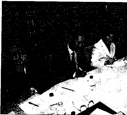
Juristas marroquíes en el CGAE.

Dentro de este proyecto, que está siendo ejecutado por la Fundación Internacional e Iberoamericana de Administración y Políticas Públicas con la colaboración de diversas instituciones españolas y marroquíes, el Consejo General de la Abogacía tiene la misión de evaluar el sistema de defensa legal en Marruecos. Para esta misión se ha desplazado a Marruecos un equipo integrado por expertos españoles y marroquíes dirigido por el vicerrector de la Universidad Carlos III de Madrid. Durante la visita, que se desarrolló del 30 de octubre al 3 de noviembre, el equipo desplazado mantuvo reuniones con magistrados, abogados y altos funcionarios de los Ministerios de Justicia y Finan-