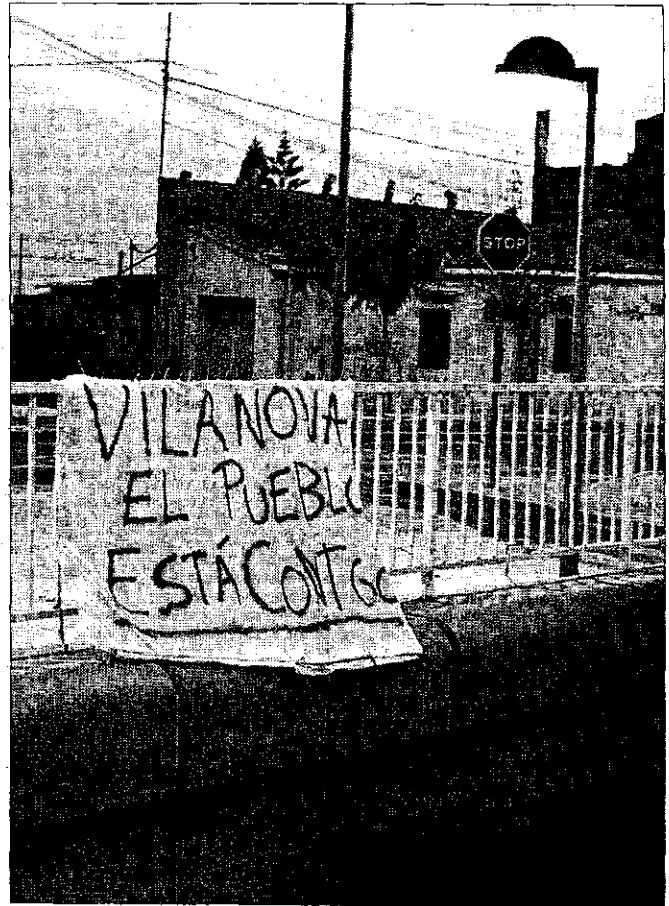
Imagen de una pancarta en la salida este de la localidad de Vila-real.