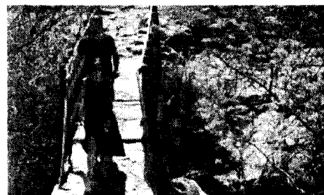
Pie de foto