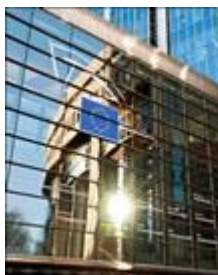
El pleno del PE ha dado luz verde a la Directiva de acceso a un abogado

El Pleno del Parlamento Europeo ha adoptado la nueva Directiva que garantiza el derecho de todos los ciudadanos a ser asesorados por un abogado cuando afronten un proceso penal. El sospechoso o acusado no podrá ser objeto de un interrogatorio sin asistencia de un abogado. También, la nueva norma permitirá que el abogado pueda participar en el interrogatorio y estar presente en determinados actos de investigación o de recogida de pruebas. Promoverá, asimismo, el respeto de la confidencialidad de las comunicaciones entre abogado y cliente. Se prevé, igualmente, la doble asistencia letrada en los casos de orden de detención europea (ODE). Las personas sujetas a esta orden tendrán el derecho de acceso a un abogado, tanto en el Estado miembro de ejecución como en el Estado miembro emisor. Si el detenido se encontrara en otro Estado miembro de la UE, también tendrán derecho a comunicarse con el consulado de su país. El voto del pleno del PE llega tras la aprobación de la propuesta por parte del Comité LIBE y el acuerdo alcanzado por triálogo con la Comisión y el Consejo el pasado mes de mayo. Los ministros de Justicia de la UE apoyaron igualmente la propuesta en su reunión de junio. Se trata de la tercera de una serie de Directivas que garantizan los derechos procesales penales de los europeos en todo el territorio UE. El texto de la Directiva de acceso a un abogado se transmitirá ahora al Consejo de la UE para su adopción formal, firma y publicación en el Diario Oficial.