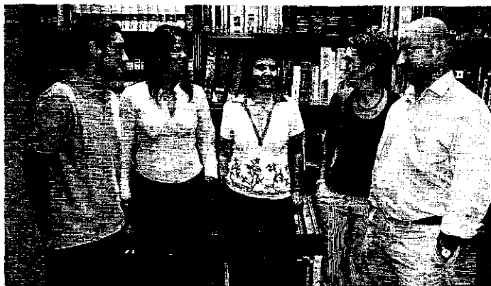
Cinco de los seis abogados que forman parte de este servicio voluntario hacia los presos.

«Te tiene que gustar brindar este servicio, a veces surgen cosas complicadas»