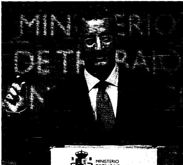
En la imagen, el ministro de Trabajo, impulsor del Decreto de la relación laboral especial de la abogacía.