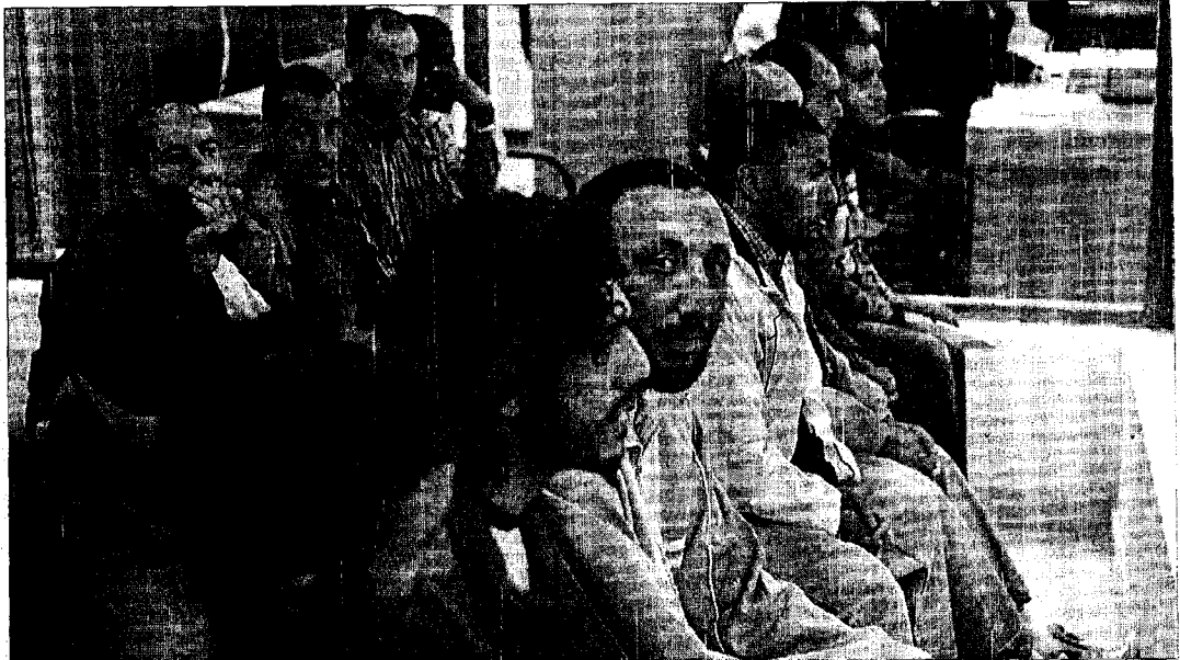
Algunos de los acusados de pertenecer a una célula de «Mártires por Marruecos» que planeaba atentar en España, ayer, durante el juicio