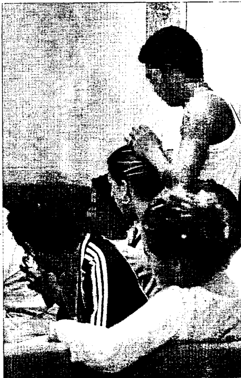
Uno de los menores acusados de violación, ayer, en Alicante.

Bienestar Social aseguró en una nota oficial que ha ejecutado "con regularidad todas las medidas judiciales impuestas a menores".