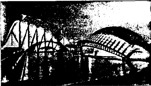
Valencia elegida centro internacional de arbitraje y mediación.