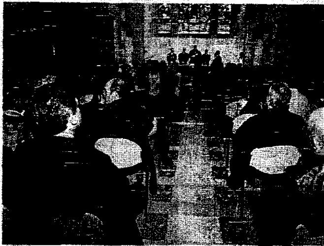
El Salón Minoralista de la sede central de Caixa Sabadell acogerá, esta tarde, la celebración

Respecto al exceso de legislación, generada en forma de leyes por el Estado y la Generalitat, y de normas por los Ayuntamientos y administraciones locales, el decano de los abogados sabadellenses manifiesta que se trata de «un atropello de profusión legislativa».