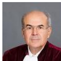
Vassilios Skouris, Presidente del TJUE