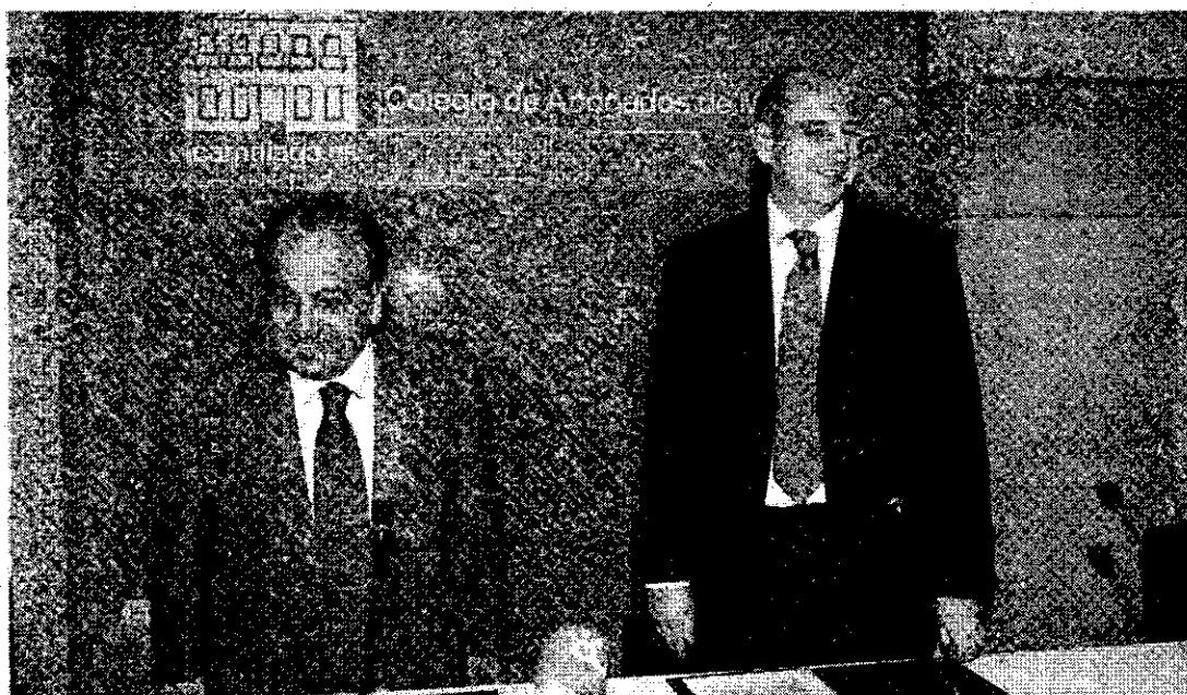
PRESENTACIÓN. Los cursos se dieron a conocer ayer en el Colegio de Abogados.