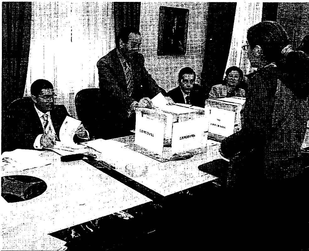
ELECCIONES. Una joven se dispone a votar en la mesa constituida en el Colegio de Abogados