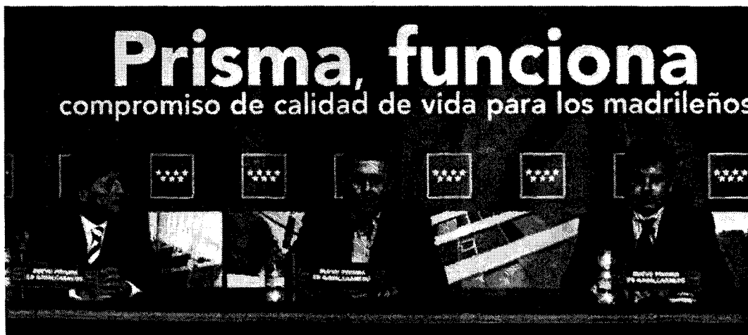
Francisco Granados (en el centro) durante un acto ayer en Navalcarnero.