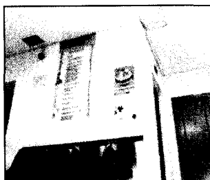
JUZGADO DE CEUTA. ARCHIVO.