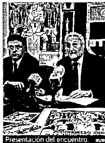
Presentación del encuentro. SUR

Las actividades se dividirán en secciones de formación y mesas redondas, en las que se tratarán asuntos relacionados con responsabilidad civil, derecho de consumo, de urbanismo, gestión de despachos o prevención de blanqueo de capitales. Además, habrá debates sobre cuestiones relacionadas con el derecho procesal e internacional.