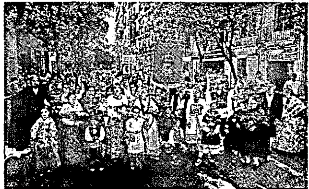
214. Colegio de Abogados de Zaragoza.