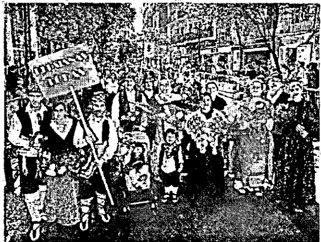
216. Persianas Loras.