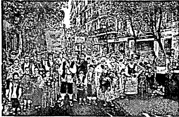
211. Santísimo Misterio de Daroca.