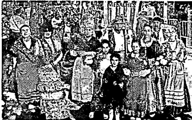
213. Asociación Cultural Mesaches.