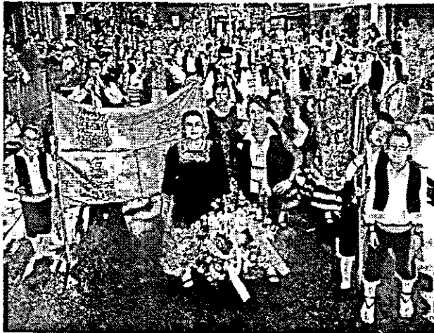
215. Asociación de Danza Yerbabuena.