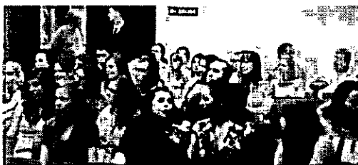
Integrantes del nuevo curso de la Escuela de Práctica Jurídica, ayer en el Colegio de Abogados.