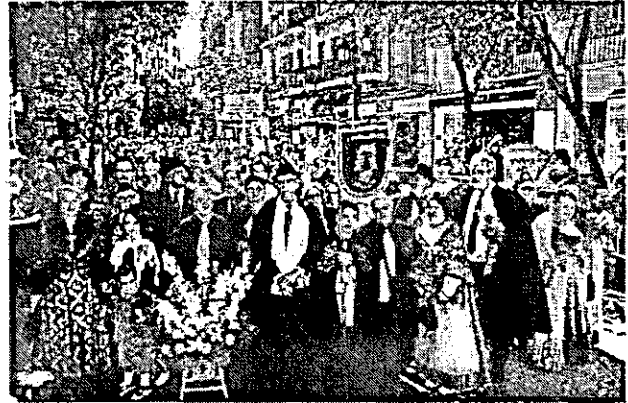
212. Asociación Cultural Amigos de la Capa.