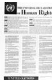
Ejemplar de la Declaración Universal de Derechos Humanos de Naciones Unidas

La Unión Europea ha celebrado el pasado 10 de diciembre un nuevo Día de los Derechos Humanos, rindiendo homenaje a los defensores de los derechos humanos, que consagran sus vidas a promover y defender los derechos fundamentales en todo el mundo. Este año, el Día de los Derechos Humanos se ha centrado en la labor de los defensores de los derechos humanos y en el papel que pueden desempeñar los medios de comunicación social para fomentar y sustentar el cambio. La "primavera árabe" ha recordado con claridad que los derechos humanos son universales y que la gente aspira en todas partes a vivir con dignidad y en libertad. En 2011, miles de personas han decidido que había llegado el momento de reivindicar sus derechos. Los medios de comunicación social se hicieron portadores de su mensaje y permitieron a activistas y particulares salir del aislamiento, difundir ideas y denunciar la opresión. El uso de los medios de comunicación social para promover los derechos humanos no debe verse restringido por los gobiernos. La UE ha condenado reiterada y públicamente las restricciones de la libertad de expresión y del acceso a internet, así como las detenciones de blogueros que están teniendo lugar en muchos países del mundo.