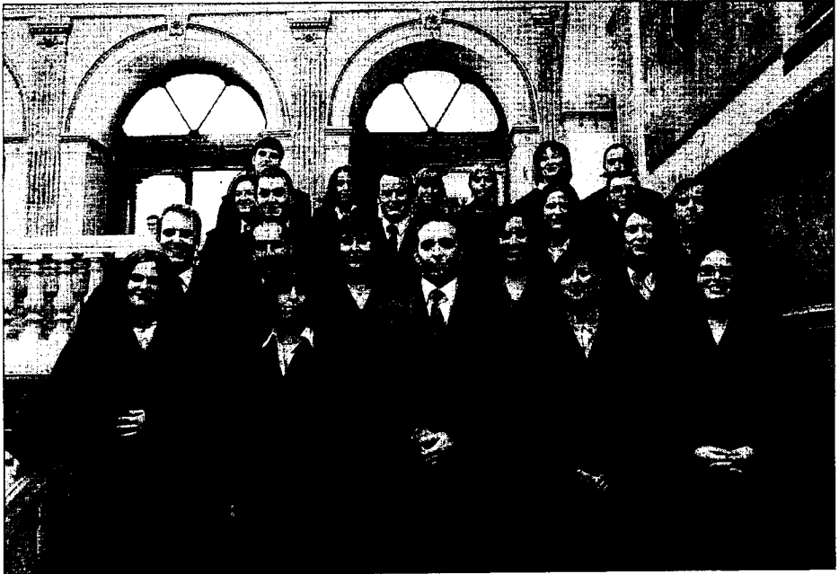
Los nuevos letrados juraron en la sala de plenos del Palacio de Justicia y posaron antes en las escaleras.