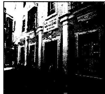
►► Fachada de la sede del Colegio de Abogados.

Del censo, 304 abogados son no ejercientes y su voto vale la mitad que el de los colegiados ejercientes.