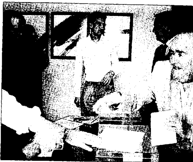
Los abogados votaron en la mañana de ayer.

La votación discurrió entre las 9.00 horas y las 14.00 horas, quedando escrutado el 100% de los votos al filo de las 16.00 horas y con una participación no excesivamente elevada. Los pro-