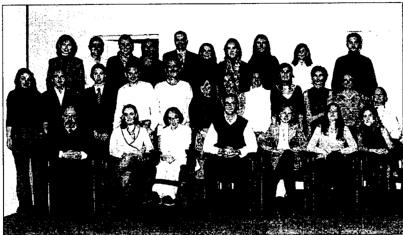
Primera promoción del Curso Superior en Derecho Privado.