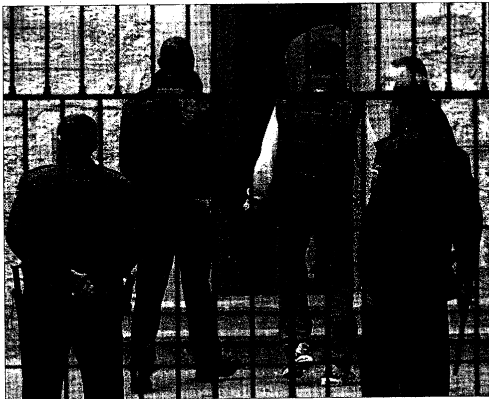
Agentes de policía trasladan a los juzgados de Alicante a un hombre acusado de agredir a una mujer embarazada.

Para esta última ciudad habían sido reclamados dos y otro para Castellón. "Con este número -dijo en general Sanahuja- no habrá una respuesta eficaz", debido a la acumulación de los casos que actualmente se reparten todos los juzgados de instrucción.