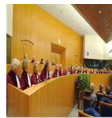
Tribunal de Justicia de la UE

La Delegación Permanente de la Abogacía Europea ante el Tribunal de Justicia de la UE (TJUE) se reunió para abordar, entre otros asuntos, la actualización de las guías prácticas para cuestiones prejudiciales, acciones directas y e-Curia, la revisión del Reglamento de Procedimiento del Tribunal General (TG). Las guías prácticas se encuentran en proceso de actualización y se difundirán, tras su aprobación por las delegaciones, en los próximos meses. Estas guías se dirigen principalmente a letrados que se personan por primera vez ante el Tribunal de Justicia de la Unión Europea, mediante cuestiones prejudiciales, o ante el Tribunal General, mediante acciones directas. Por ejemplo, la guía práctica de acciones directas tiene como finalidad mejorar la eficiencia en el uso de estas acciones, tales como: el recurso de anulación o el recurso de omisión. La guía práctica sobre la aplicación “e-Curia” se dirige a aquellos letrados que deseen intercambiar escritos procesales con las Secretarías de los tres órganos jurisdiccionales por vía exclusivamente electrónica. El Comité Permanente también revisó el Reglamento de Procedimiento ante el TG. Por último, la reunión anual con el TJUE tendrá lugar en septiembre.