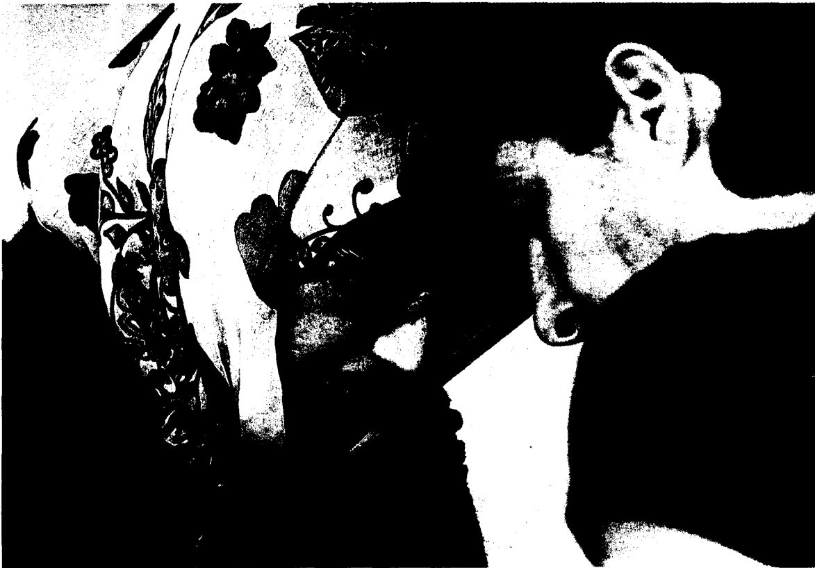
La activista saharauí, Aminatou Haidar, ayer, en el aeropuerto de Lanzarote.

Huelga de hambre. La activista saharauí cumple 29 días sin tomar alimentos