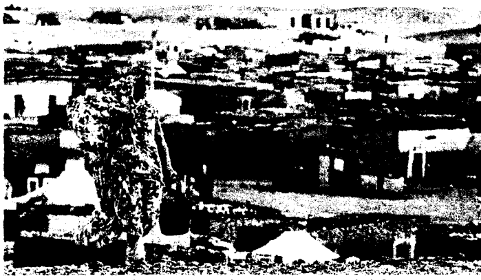
Una refugiada saharauí acarrea agua en los campamentos de Tinduf.

La primera cosa que voy a hacer es agradecer a todas las personas que están conmigo desde el primer día de huelga. Daré también las gracias a los periodistas, que han tenido un papel fundamental en contar la realidad. La otra vez ya avisé por teléfono a mis familiares desde el avión [se refiere al vuelo frustrado a El Aaiún del pasado 4 de diciembre] y al final el regreso no fue posible. Ahora voy a exigir totales garantías de que voy a volver a mi casa, y será entonces cuando telefonee a mis hijos.