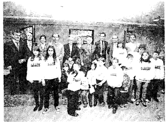
Un momento de la reunión del 50 aniversario de la Declaración de los Derechos del Niño