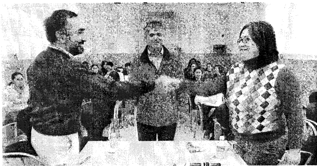
Los trabajadores sociales realizan un curso para formarse en la mediación según lo establecido por la nueva ley andaluza.