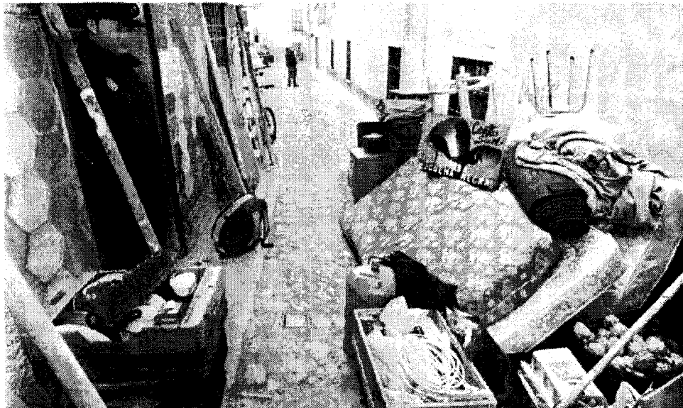
Colchones y muebles en la calle tras el desahucio de un local.

En Badajoz, más del 70% de las viviendas en alquiler no se declara y, por tanto, se ubica fuera de cualquier regulación. Este alto porcentaje induce a pensar que puede haber un volumen importante de desahucios fuera de las vías judiciales, protagonizado por los arrendatarios e inquilinos que establecieron su relación de forma verbal. Ellos no pasan por la asesoría jurídica.