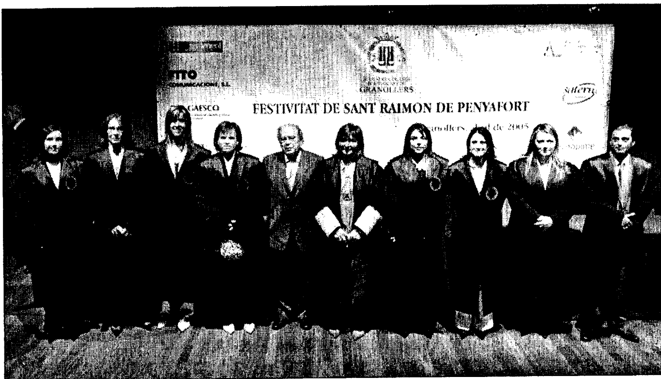
L'expresident Pujol i Lídia Condal amb els nous advocats en l'acte d'aquest divendres a la sala petita del teatre auditori de Granollers.