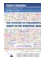
Audiencia del PE sobre derechos fundamentales