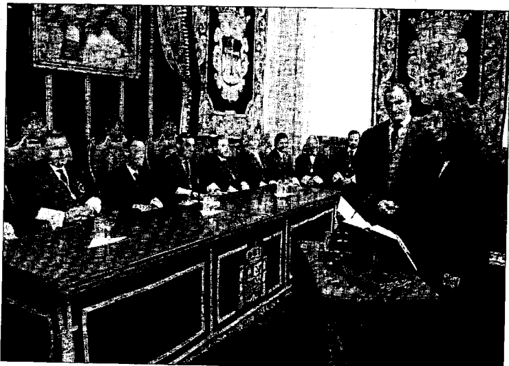
► Una abogada jura su cargo en el Paraninfo de la Universidad.

El día terminó con una comida de confraternidad celebrada en el hotel AC Forum de Oviedo. Hoy habrá un acto más, se trata de una reunión de abogados jubilados, a la que se espera que acudan 60 colegiados retirados, que tendrá lugar a las 19.00 en el Paraninfo de la Universidad. ■