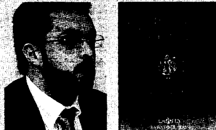
El libro fue presentado por el autor en la sala de actos