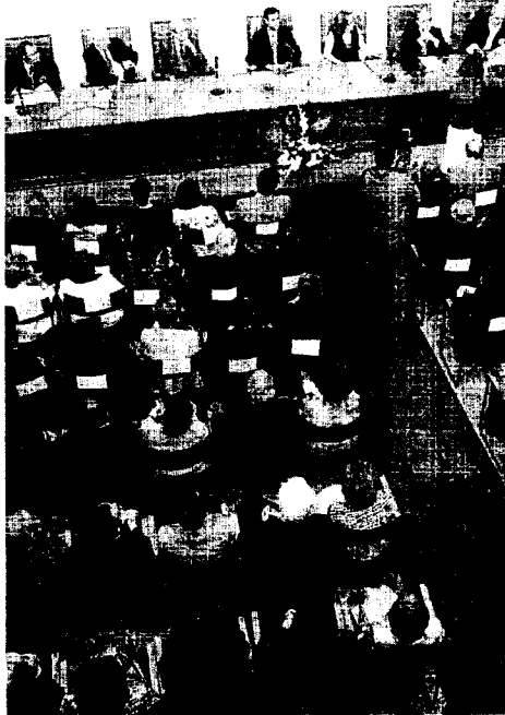
Salón del Colegio de Abogados, abarrotado.

A sus palabras siguieron las del ministro, igualmente emotivas. Del “decano” dijo que “nos encontramos ante una personalidad singular que merece este reconocimiento, es un abo-