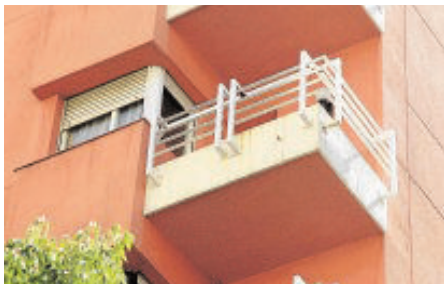
El balcón del piso donde ocurrió el crimen