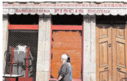
La hamburguesería, escenario del disparo