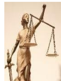
Publicado el informe sobre aplicación de la Carta UE de Derechos Fundamentales

La Comisión Europea ha hecho público el informe sobre la aplicación de la Carta Europea de Derechos Fundamentales durante 2014. La nueva Comisión se ha comprometido a asegurar una protección y un desarrollo eficaces de los derechos fundamentales en la UE. El informe de 2014 incluye por primera vez una sección sobre la cuestión de los derechos fundamentales en el entorno digital y en especial la aplicación del Derecho Europeo a los contenidos en nube. Los ciudadanos tienen derecho a una protección adecuada de sus derechos fundamentales tanto en línea como fuera de ella, y de forma específica, la de sus datos personales garantizada por el artículo 8 de la Carta. Los Tribunales de la UE se remitieron con creciente frecuencia a la Carta en las resoluciones que adoptaron a lo largo de 2014 año en el que 210 resoluciones hicieron referencia a la Carta, frente a 114 en 2013. La CE trabaja junto con las autoridades nacionales, regionales y locales competentes y con las demás instancias de la UE para informar mejor a los ciudadanos acerca de sus derechos fundamentales y de la asistencia que pueden recibir si consideran que se han vulnerado. La Comisión ofrece actualmente información práctica sobre el ejercicio de los derechos individuales en el portal europeo E-justice y ha entablado un diálogo sobre la tramitación de las demandas sobre derechos fundamentales con los defensores del pueblo, los organismos de defensa de la igualdad y las instituciones de derechos humanos.