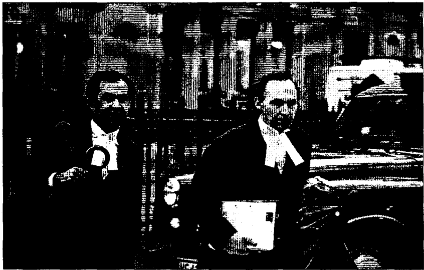
Dos letrados Ingleses a la salida de un juicio.

En un documento en el que se analiza la propuesta británica, el Consejo de la Abogacía Europea recomienda no seguir adelante con la reforma y alerta de