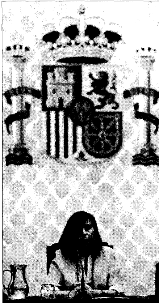
La presidenta del Constitucional, María Emilia Casas.