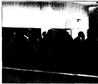
LETRADOS EN UN JUICIO.