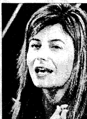
La ministra de Igualdad, Bibiana Aído

Magro propugnó que cuando se inicia el procedimiento mediante denuncia, la víctima no