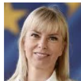
Elizabeta Bienkowska, Comisaria europea de Mercado Interior, Industria, Emprendimiento y PYMEs

La Comisión Europea ha enviado una propuesta al Parlamento Europeo y al Consejo para la codificación del Derecho europeo de Sociedades a través de una sola Directiva (Documento COM (2015) 616 final), modernizando y agilizando la normativa europea en este ámbito. El objeto de la presente propuesta es proceder a la codificación de las siguientes normas, todas ellas relativas al Derecho de Sociedades: la Directiva referente a la escisión de sociedades anónimas (82/891/CEE), la Directiva de publicidad de las sucursales constituidas en un Estado miembro por determinadas formas de sociedades sometidas al Derecho de otro Estado (89/666/CEE), la Directiva 2005/56/CE relativa a las fusiones transfronterizas de las sociedades de capital, la Directiva 2009/101/CE sobre garantías exigidas en los Estados miembros a las sociedades para proteger los intereses de socios y terceros, la Directiva 2011/35/UE relativa a las fusiones de las sociedades anónimas, la Directiva 2012/30/UE sobre garantías exigidas en los Estados miembros a las sociedades. La propuesta de nueva Directiva sustituirá a las que son objeto de la operación de codificación respetando en su totalidad el contenido de los textos codificados y limitándose a reagruparlos realizando en ellos únicamente las modificaciones formales que la propia operación de codificación requiere.