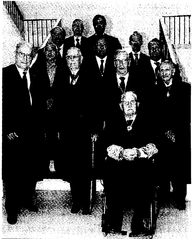
RECONOCIMIENTO. Imagen del grupo de profesionales distinguidos.