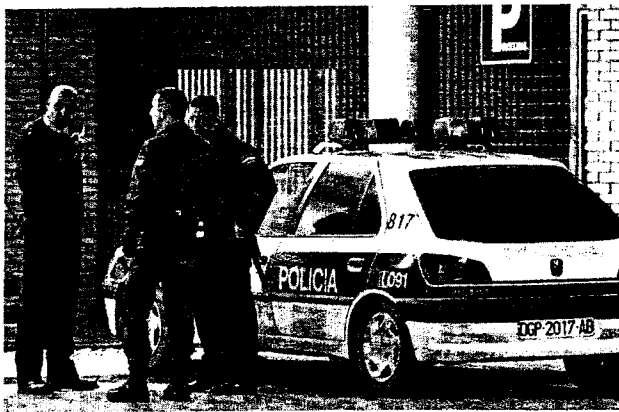
La Policía controla los accesos del hospital donde está ingresado el detenido

Sus compañeros de piso declararon ayer a Canal 9 que la noche de los hechos el detenido llegó a casa herido, con un ojo morado y manchas de sangre y se justificó ante ellos diciendo que había sido víctima de un robo.