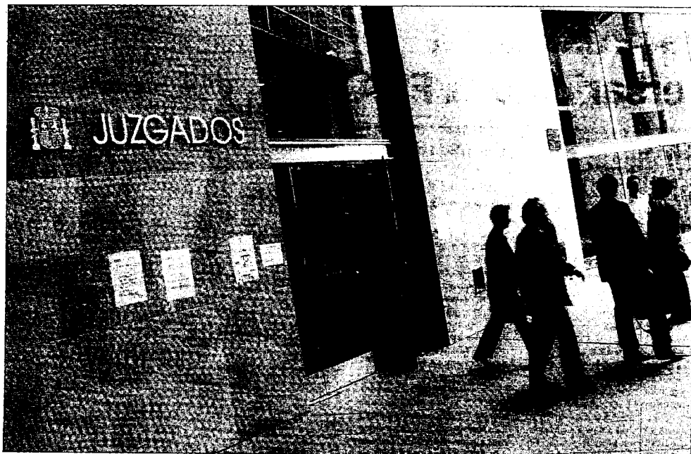
►► Imagen de la fachada de los juzgados de Oviedo.