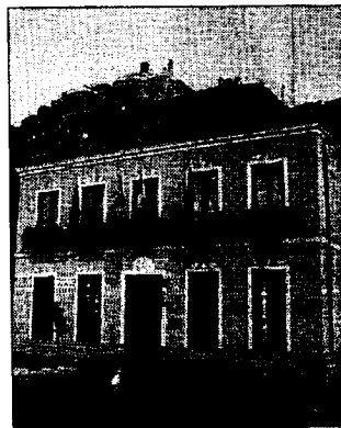
Sede del Colegio de Abogados.