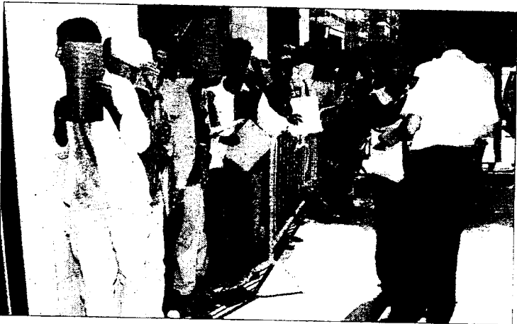
■ Imagen de archivo de la Oficina de Extranjeros en Almería.