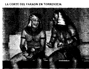
LA CORTE DEL FARAON EN TORREVIEJA