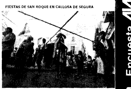
Fiestas de San Roque en Callosa de Segura

El acto tuvo lugar en el Colegio de Abogados de Orihuela después de que el Consejo Valenciano de Abogados celebrase su pleno en el colegio Santo Domingo de esta ciudad. Al evento asistieron letrados y jueces, así como el presidente del Consejo General de la Abogacía Española, Carlos Carnicer.