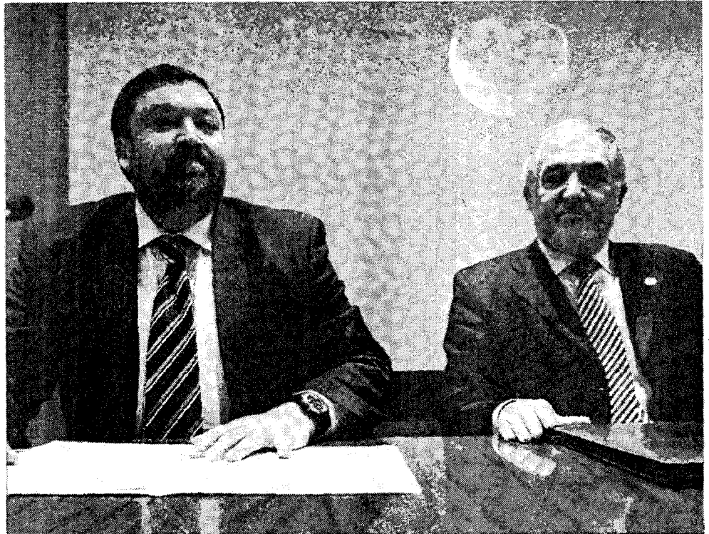
El ministro Caamaño, junto a Cándido Conde-Pumpido, en un acto en la Fiscalía General el pasado noviembre.

La exposición de motivos calificó de «reajuste» la modificación de las penas por narcotráfico y lo atribuye a la aplicación de decisiones marco europeas. «Se refuerza el principio de proporcionalidad de la pena, reconfigurando la relación entre el tipo básico y los tipos agra-