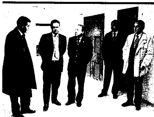
Un momento de la visita a los nuevos Juzgados

Por otra parte, el delegado informó que el próximo año será aprobada por el Parlamento Andaluz la permuta del palacio de los Condes de Santa Ana, actual propiedad de la Junta de Andalucía y sede judicial, cuyo edificio está declarado Bien de Interés Cultural, por la parcela municipal