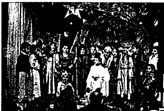
Niños. El Colegio Sierra Nevada celebra su fiesta de Navidad. R.O.A.

Hay Belenes de 5GL, como el de la Casa de los Tiros. Los hay adorables, como el de los hermanos Pedraza. Está el Belén de esta casa —por cierto, ¿dónde está?—, o está el que han formado los de Lo Mónaco en favor de sus compañeros