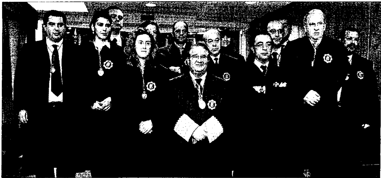
BALANCE. Foto de familia de la junta de gobierno del Colegio de Abogados de Jaén, tras la incorporación de sus nuevos miembros.