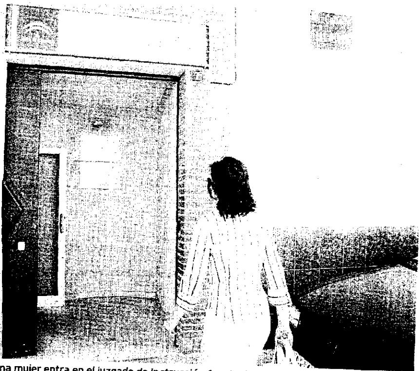
SATURADO. Una mujer entra en el juzgado de Instrucción 1, actualmente muy cargado.

mera instancia que reclaman los abogados para asuntos civiles, la reivindicación de Carazo también tiene respaldo estadístico en los datos del TSJA, que afinaba incluso pidiendo un nuevo juzgado específico para asuntos de familia. El juzgado de lo contencioso, según reclamaba recientemente una asociación de magistrados, también están al borde de la satu-