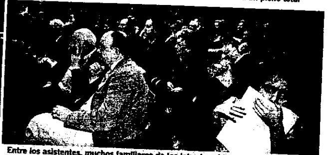
Entre los asistentes, muchos familiares de los letrados objeto del homenaje