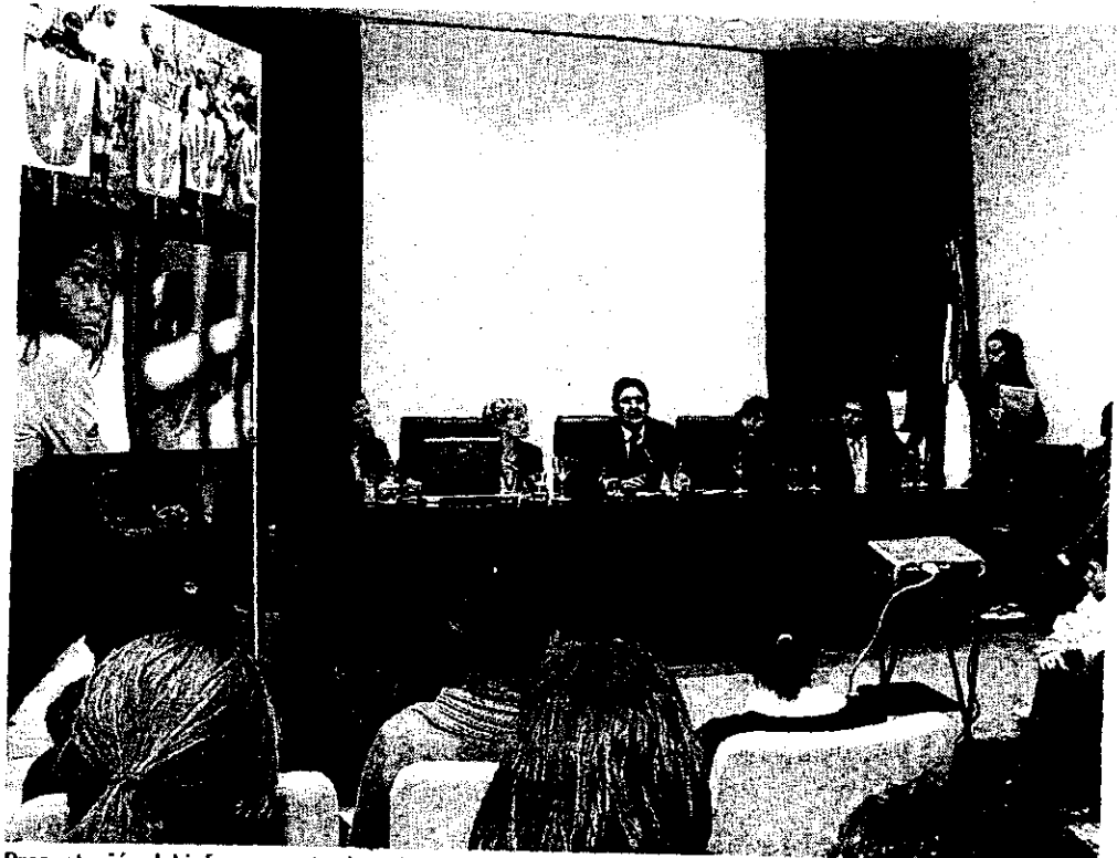
Presentación del informe contra la utilización de niños soldados en el Colegio de Abogados de Sevilla ABC

nen un paso más de la Comunidad Internacional para acabar con esta horrible práctica. Entre los compromisos adoptados cabe destacar el de luchar contra la impunidad, investigar y perseguir de manera efectiva a las personas que han reclutado ilegalmente niños menores de 18 en grupos o fuerzas armadas. De la misma forma, estos gobiernos se han comprometido a garantizar suficientes recursos para conseguir una efectiva rehabilitación en sus comunidades de los niños que han participado en conflictos bélicos.