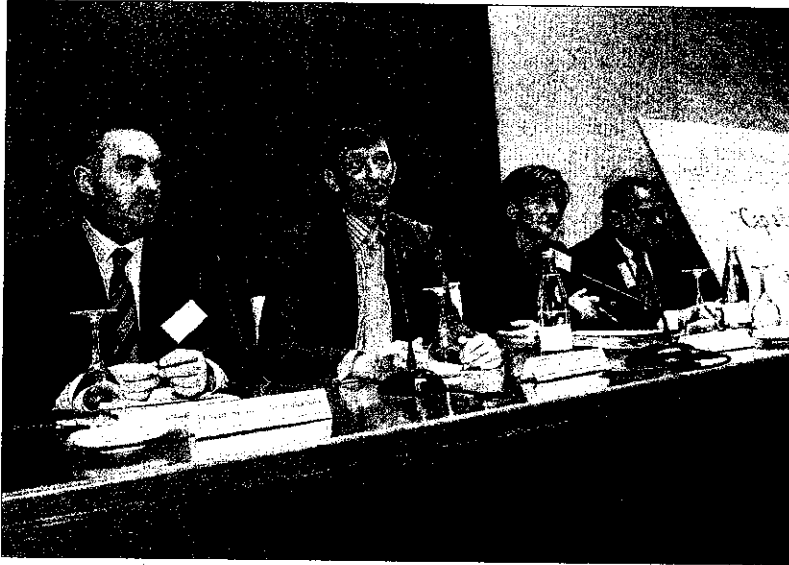
La reunión sirvió para debatir algunos de los cambios sufridos en la profesión.

El debate sobre el nuevo Código Deontológico y las mejoras en la justicia gratuita centraron el encuentro en el que se buscaron fórmulas para modernizar la abogacía.