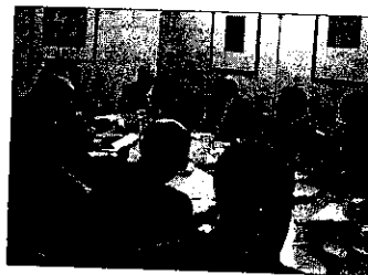
El grupo de asistentes en un momento de la tertulia.

Los incesantes cambios producidos, así como las consecuentes tensiones que de ellos se derivan, han convertido al sector energético en un campo muy propicio para resolver los conflictos existentes de forma extrajudicial, a través de instituciones como la Mediación y el Arbitraje. Cuestiones como el porcentaje de incremento de las tarifas y la propia asunción de un déficit tarifario, la repulsa o la apuesta decidida por la energía nuclear, la integración de gas y electricidad, el esquema retributivo de las energías renovables, los movimientos corporativos o la seguridad de las inversiones transfronterizas, son asuntos que reflejan la existencia de posiciones encontradas y conflictos soterrados que es preciso clarificar cuanto antes; y es en este punto donde el Arbitraje —impulsado por la Ley que entró en vigor en 2004— se presenta como una eficaz herramienta alternativa.