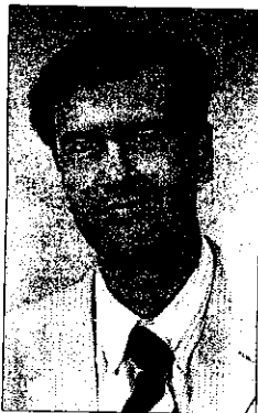
Juan Fernando López Aguilar.

El ministro de Justicia recibió este galardón por el conjunto de méritos demostrados en su trayectoria académica y científica, cuyos orígenes están unidas a esa Universidad andaluza. La vincula-