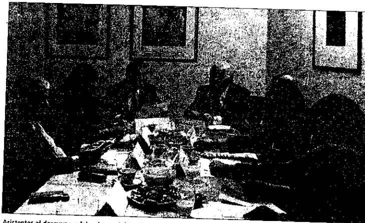
Asistentes al desayuno celebrado por Arbitralia.