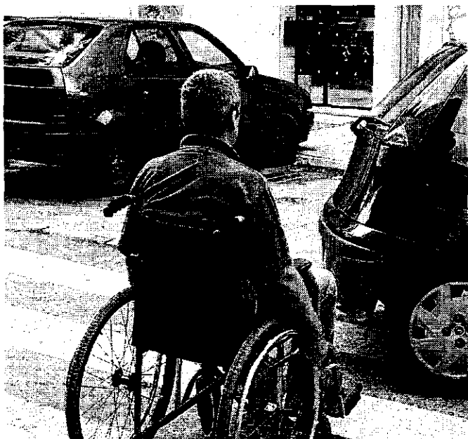
Algunos discapacitados recurren a la justicia gratuita para reclamar mejoras en la accesibilidad de las vías urbanas.

La comisión jurídica de Futuex prevé que en las próximas semanas aumente considerablemente el volumen de casos