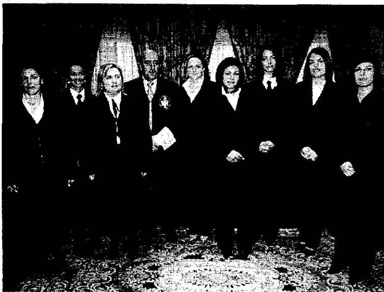
Las nuevas letradas con el decano del Colegio de Abogados.