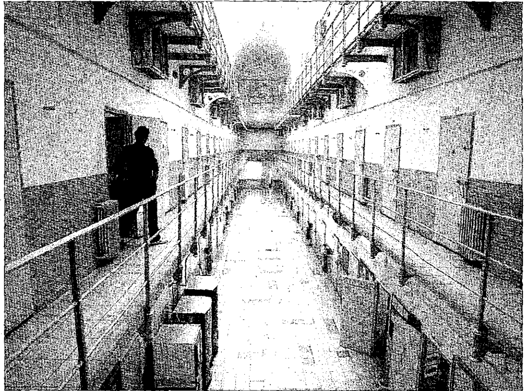
Interior de una de las galerías del Centro Penitenciario de Hombres de Barcelona.

Los abogados barceloneses también denuncian que el modelo de prestación de servicio implantado por la Generalitat «es una de las principales causas de que el sistema no funcione ade-