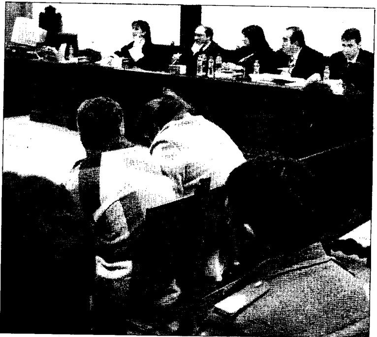
Las decisiones de los jueces no son consideradas siempre 'justas'.

La asociación, que pretende evitar este tipo de situaciones, explica detalladamente los derechos de los ciudadanos en su portal cibernético, www.andapeaj.org y ofrece la posibilidad de compartir situaciones y opiniones.